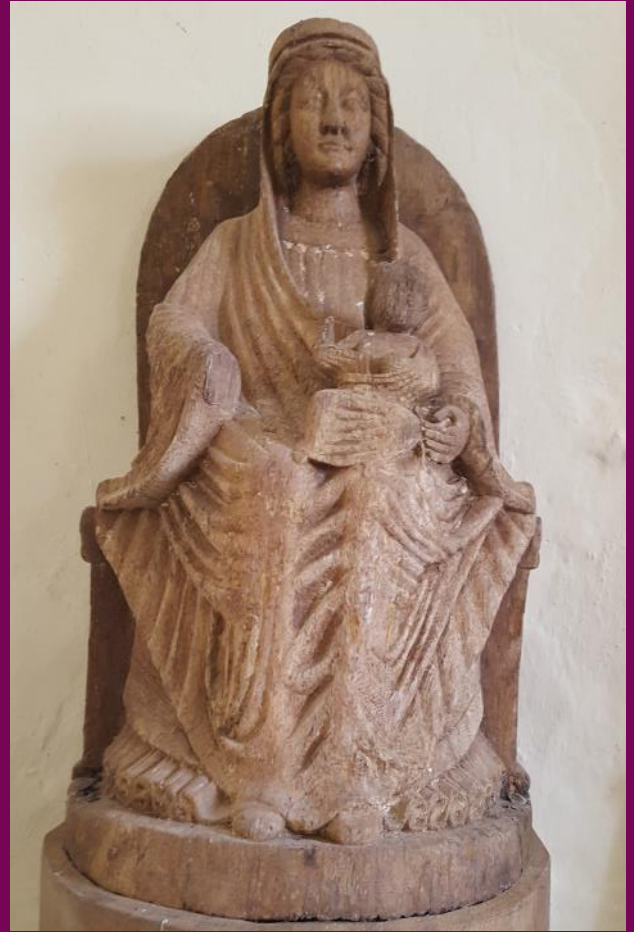
Abb.15: Thronende Madonna, Ev. Kirche, Laase, Landkreis Rostock

Mittelalterliche Skulpturen sind stehen nicht frei im Raum. Sie sind in einen architektonischen Zusammenhang eingebunden: Etwa auf einem Sockel vor einem Pfeiler stehend mit einem Baldachin oder in eine andere Form von Gehäuse eingestellt.