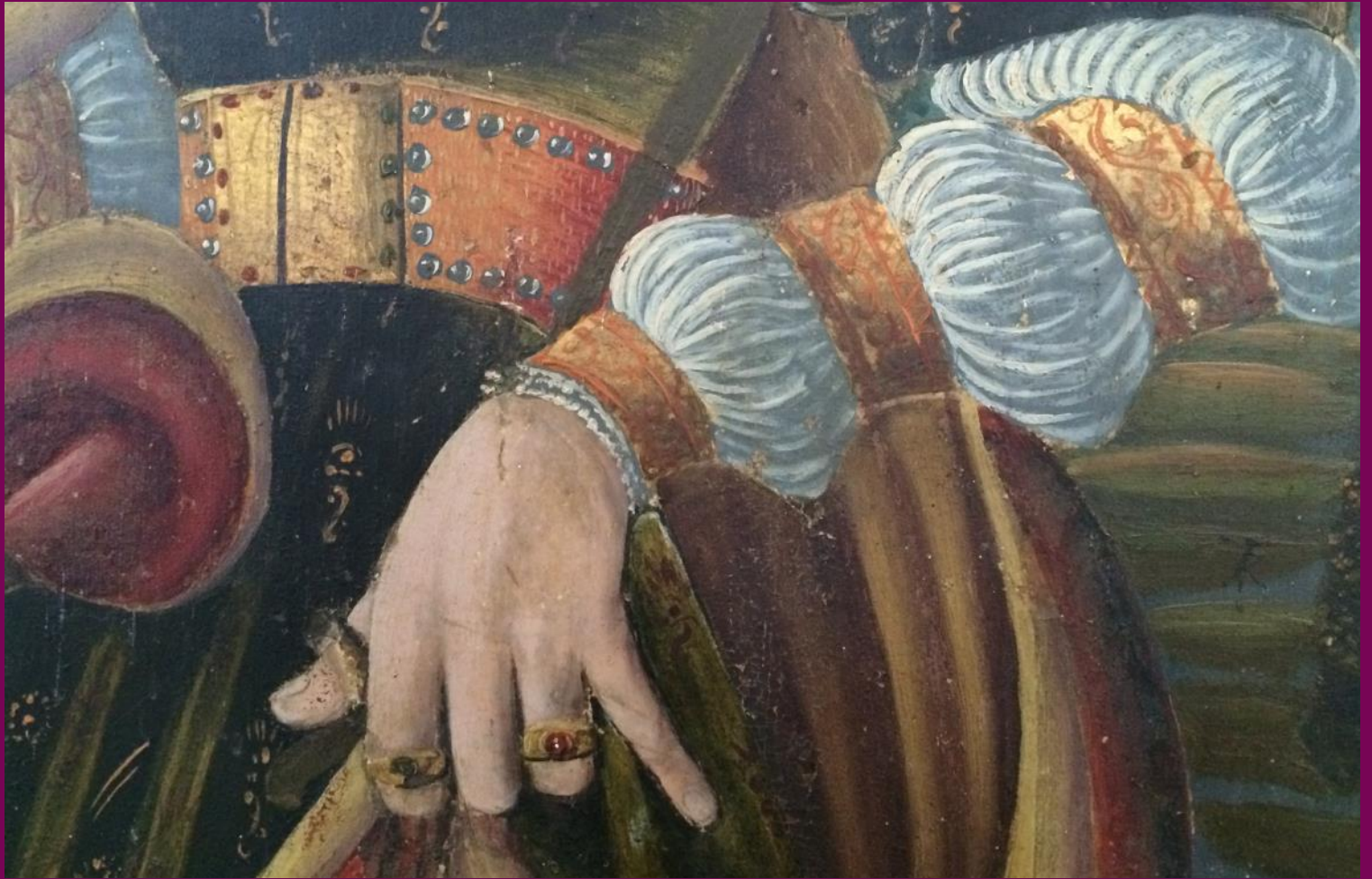
Abb. 11: Hl. Dorothea, Detail, Flügelretabel, St. Georgskirche, Eixen, Landkreis Vorpommern-Rügen