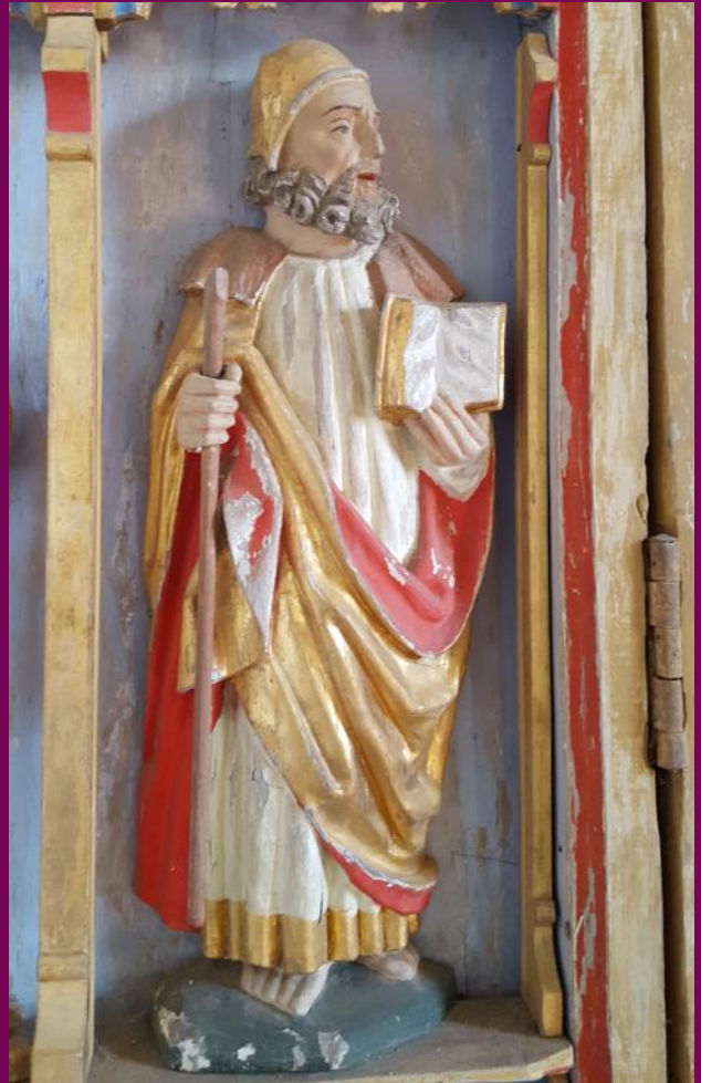
Abb. 25: Flügelretabel, Festtagsansicht, Detail, Ev. Kirche, Garwitz, Landkreis Ludwigslust-Parchim

Die Reformation wirkte sich im Laufe des 16. und 17. Jahrhunderts sehr auf das Bildprogramm der Flügelretabel aus. Die Schreine und Flügel wurden Überformungen und Umbauten unterworfen: Baldachine wurden entfernt, Flügel festgestellt, neue Rahmen konstruiert. Aber es kam auch vor, dass nur die Schreine und die Flügel die Jahrhunderten überdauerten. Beispiele finden wir in Wismar, Heiligen-Geist-Kirche, Schobüll, Kreis Nordfriesland und in der Johanneskirche in Wusterhusen, Landkreis Vorpommern-Greifswald. Das Wusterhusener Retabel hat sich bis zur Unkenntlichkeit verändert (Abb. 30).