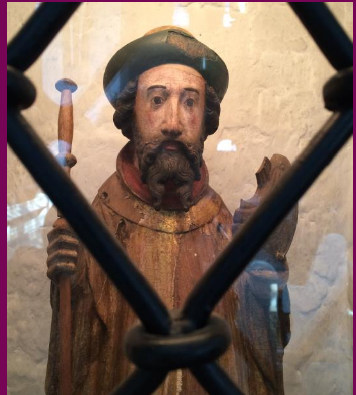
Abb. 2: Hl. Jacobus, St. Nikolai-Kirche, Mölln, Kreis Herzogtum Lauenburg

Das Triumphkreuz in der Möllner Nikolaikirche (Abb. 1) stammt vermutlich aus einer Lübecker Werkstatt. Die inmitten des Naturparks Lauenburgische Seenplatte gelegene Stadt Mölln war im Mittelalter ein aufstrebender Rast- und Marktort am Handelsweg zwischen Lübeck und Lüneburg. Sie stand von 1359 bis 1683 unter Lübecker Verwaltung. Aufgrund dieser engen Verflechtung ist es zu vermuten, dass auch weitere Ausstattungstücke der Kirche in Lübecker Werkstätten angefertigt worden sind. So zum Beispiel der Marienleuchter, die Bronzetaufe und auch die Figuren (Apostel, Marienkrönung) eines Flügelretabels, die sich heute im St. Annen-Museum, Lübeck, befinden: Sie gehörten wahrscheinlich einst zum Hochaltar der Nikolaikirche. Eine der Apostelfiguren ist noch heute vor Ort zu sehen: In einer Wandnische steht hinter einem Metallgitter die Figur eines Jacobus (Abb. 2). In Pilgertracht gekleidet, mit Hut, Stab und Mantel, vermittelt er uns einen Eindruck von der Schönheit mittelalterlicher Fassungen (Bemalung): Der vergoldete Mantel beherrscht den farblichen Eindruck. Mit Rot, Grün und Blau sind einzelne Partien abgesetzt. Hände, Füße und das Gesicht sind in einem zarten Inkarnat (Fleischtöne) bemalt. So waren auch die anderen Figuren der Möllner Gruppe bemalt. Heute haben sie ihre Fassung verloren(!). steht hinter einem Metallgitter die Figur eines Jacobus (Abb. 2).