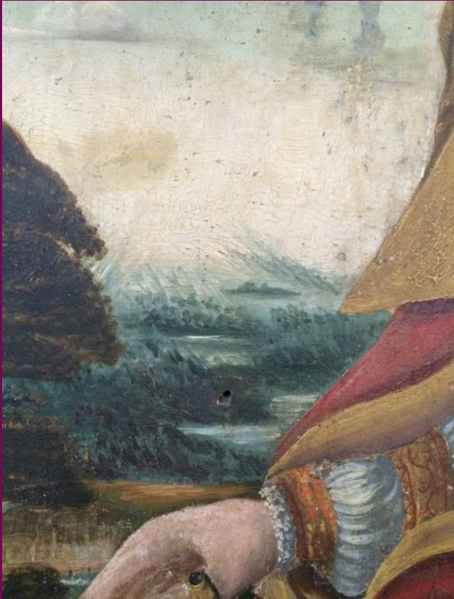
Abb. 9: Hl. Dorothea, Detail, Flügelretabel, St. Georgskirche, Eixen, Landkreis Vorpommern-Rügen

In der Amtsrolle der Lübecker Maler und Glaser von 1425 und 1476 wird eine hohe Qualität von „geistlichem Gut“ festgelegt. Was dies konkret hieß, ist leider nicht ausgeführt. Einzig die Verwendung von Eichenholz, das besonders widerstandsfähig gegen Schädlingsbefall und witterungsbeständig war, wird in der Lübecker Rolle genannt. Es ist davon auszugehen, dass Qualitätsstandards bei der Verarbeitung der Werkstoffe im Werkstattbetrieb vermittelt wurden und daher keiner weiteren Erwähnung bedurften. Allerdings werden diese Standards auch immer im Konflikt mit möglichen zeit- und geldsparenden Techniken gestanden haben, so zum Beispiel die Schnelltrocknung von „grünem“ Holz über dem Feuer statt der Verwendung von abgelagertem, trockenem Holz.