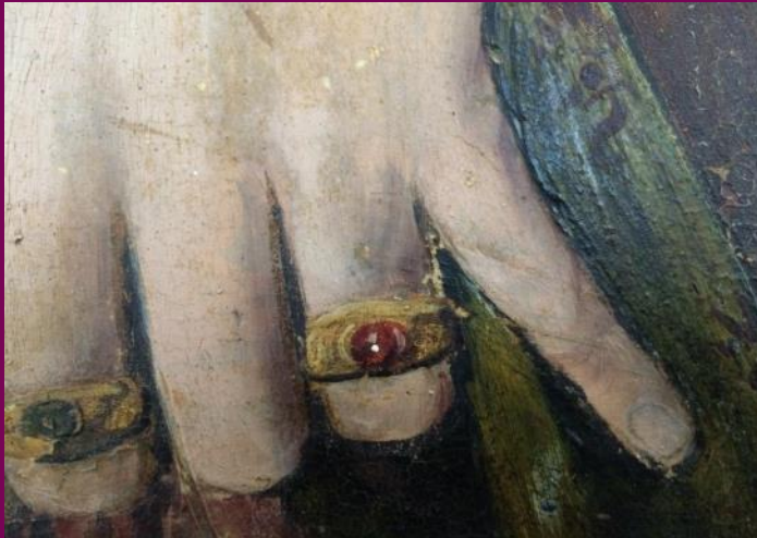
Abb. 7: Hl. Dorothea, Detail, Flügelretabel, St. Georgskirche, Eixen, Landkreis Vorpommern-Rügen

Die Malereien des Flügelretabels der Nikolaikirche in Tallin werden heute der Werkstatt Hermen Rodes zugeschrieben. Im Kirchenbuch wird dieser Name jedoch nicht genannt. Durch die Methode der Stilkritik, das heißt des Vergleiches von Bildern, können die Malereien jedoch eindeutig diesem Meister zugeschrieben werden. Interessant ist, dass es offenbar für die Führung des Kirchenbuches unerheblich war, welcher Künstler die Bilder schuf. Er hielt lediglich fest, dass es sich um ein Werk aus Lübeck handelte (vgl. Rasche, 2013).