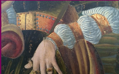
St. Annen-Kirche, St. Annen, Kreis Dithmarschen