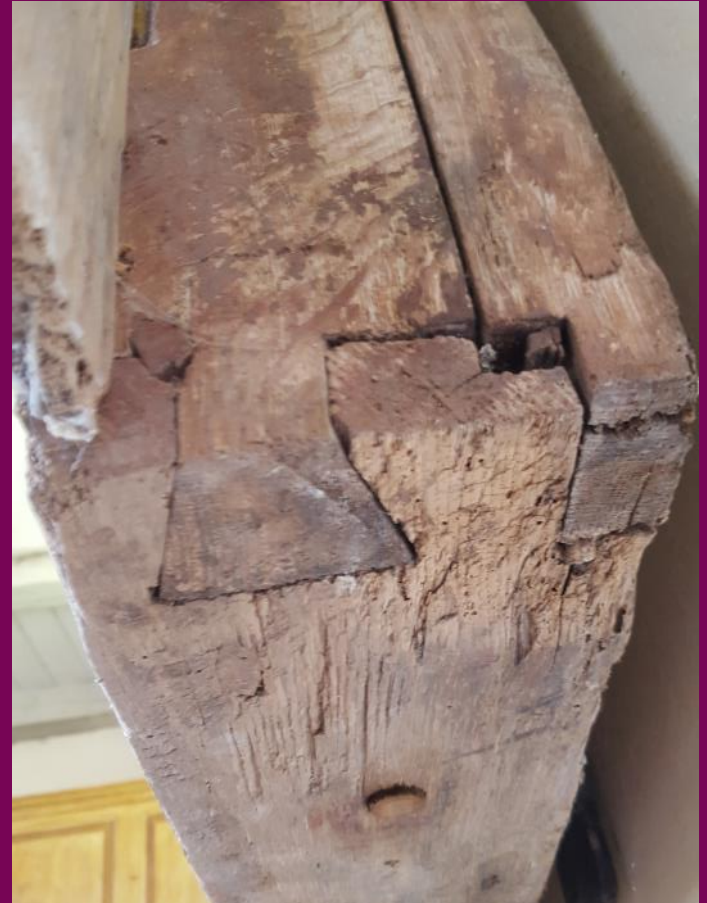
Abb. 19: Eckverbindung der Rahmenezarge mit Schwalbenschwanz, Schrein, Flügelretabel, Ev. Kirche, Laase, Landkreis Rostock

Schwalbenschwänze sind trapezförmige Zinken (Abb. 19). Sie wurden mit dem Stechbeitel aus dem Holz heraus gestemmt. Sie greifen passgenau in ein Gegenstück und gewährleiten eine stabile Eckverbindung der Kastenflügel. Diese Art der Eckverbindung setzte sich im ersten Drittel des 15. Jahrhunderts in der Retabelproduktion in Norddeutschland flächendeckend durch.