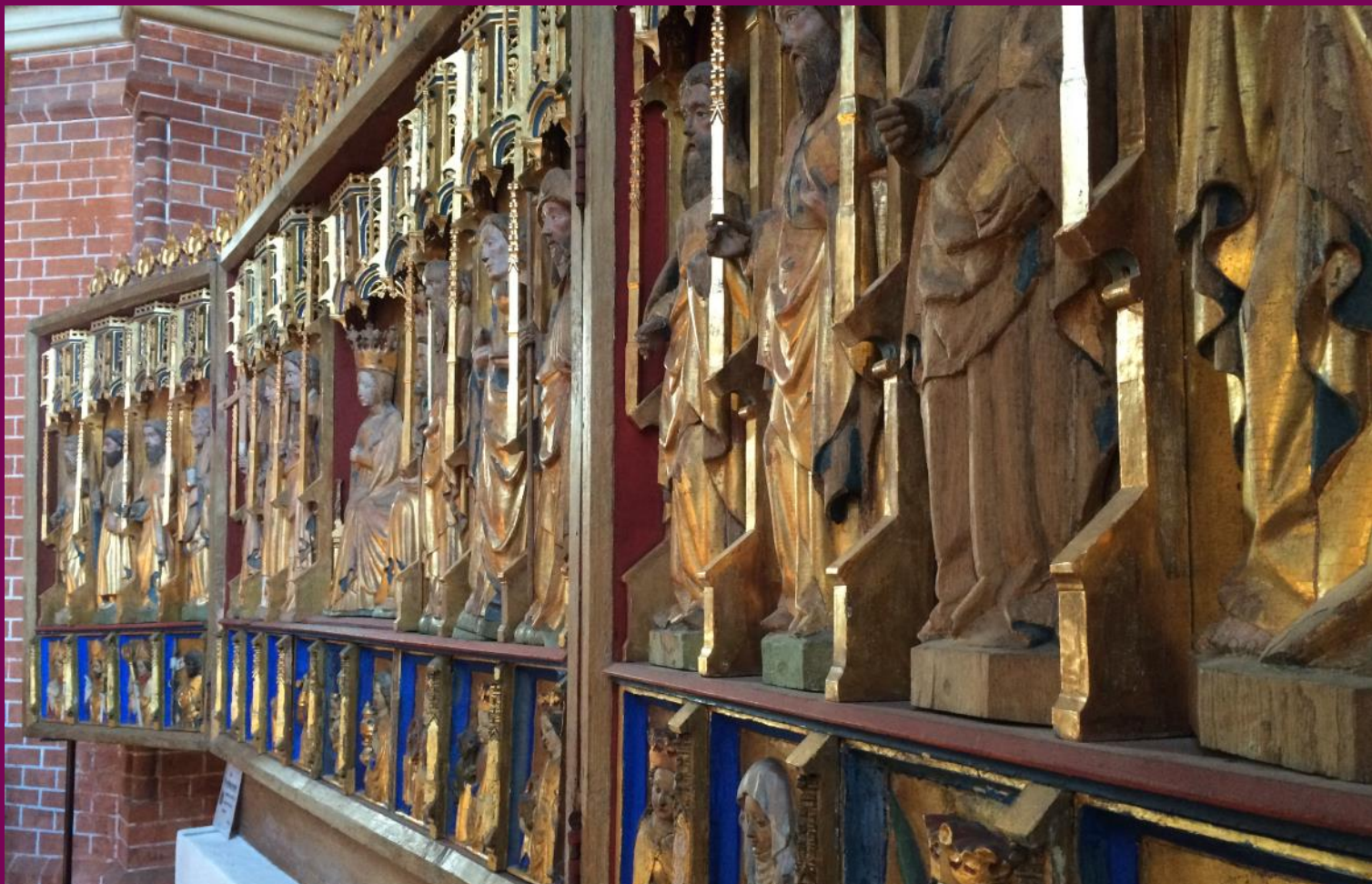
Abb. 17: Flügelretabel, Festtagsansicht, St. Peter und Pauls Kirche, Teterow, Landkreis Rostock