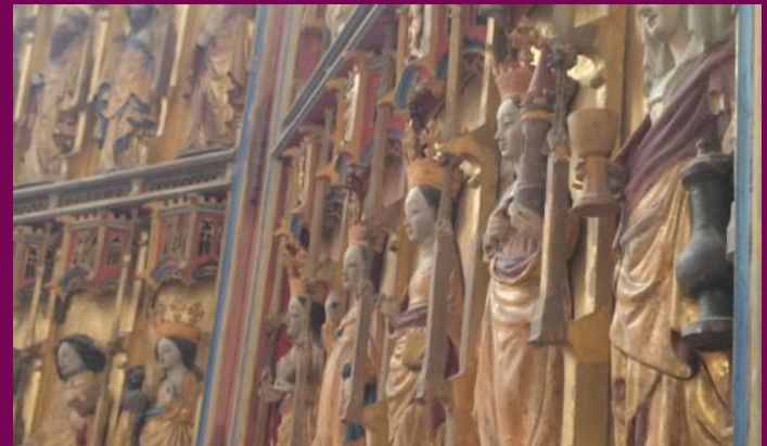
Abb. 4: Flügelretabel, St. Johanniskirche, Malchin, Kreis Mecklenburgische Seenplatte

Für den Gesamtauftrag gab es in der Regel einen Hauptauftragnehmer. Dies konnte der Maler-, Bildschnitzer- oder Kontormacher-Meister sein. Der Hauptauftragnehmer hielt mit dem Auftraggeber die Eckdaten des Auftrags fest: Größe des Retabels, Bildprogramm, Anzahl der Flügel, Anzahl der Figuren, Verteilung der Figuren im Schrein sowie die zu verwendenden Farben und die Menge des Goldes. Über die Kosten des Retabels entschieden die Anzahl der Figuren und der Preis der Farben und Metalle. Der Hauptauftragnehmer vergab nun seinerseits Subaufträge an die anderen Gewerke.