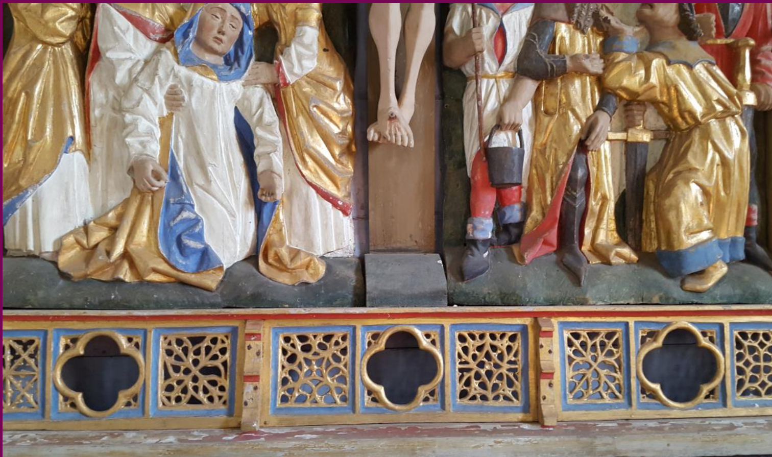
Abb. 27: Flügelretabel aus der Kirche in Crivitz, Festtagsansicht, Detail, Ev. Kirche, Garwitz, Landkreis Ludwigslust-Parchim