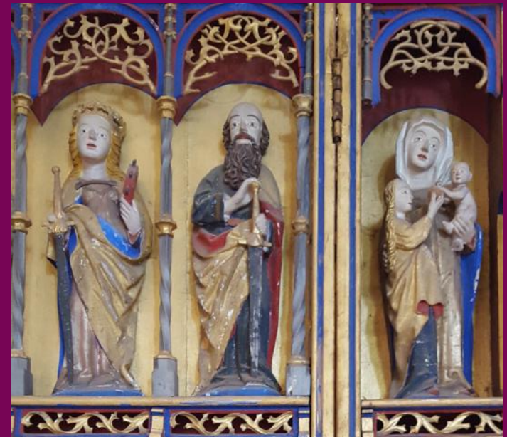
Abb. 26.: Flügelretabel, linker Flügel, Detail, Ev. Kirche, Frauenmark, Landkreis Ludwigslust-Parchim

Außer den Schnitzarbeiten und den Tafelbildern können demnach auch die Konstruktion des Retabels und seine Innenarchitektur für die Zuordnung eines Retabels zu einer Werkstatt genutzt werden. Es lohnt sich also genauer hinzusehen!