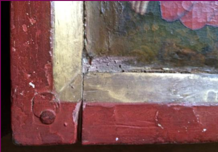
Abb. 21: Eckverbindung, Gemäldeflügel, Flügelretabel, St. Peter und Pauls Kirche, Teterow, Landkreis Rostock

Die Herstellung der Baldachine und der Trennelemente zwischen den Figuren gehörten, soweit nachweisbar, ebenfalls zur Aufgabe des Kontormachers. Die Baldachine des Schreins sind im Retabel in Garwitz (Abb. 23) als dreiseitige, räumlich ausgreifende Elemente gestaltet. Die Baldachine der Flügel sind flache Schleierbretter, die ebenfalls gotisches Maßwerk zeigen. Innerhalb des Retabels wird auf diese Weise die Hierarchie der Teile sichtbar gemacht: Die Bedeutung der Bildinhalte steigert sich von außen nach innen.