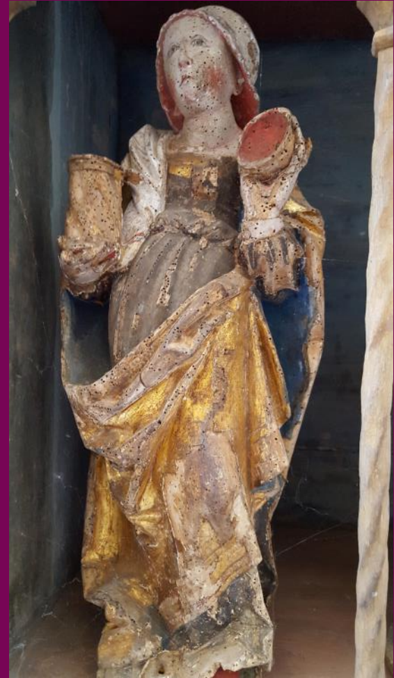
Abb. 13: Hl. Maria Magdalena, Ev. Kirche, Horst

Wollte der Auftraggeber im Bild kenntlich gemacht werden, etwa durch sein Wappen oder durch eine Inschrift, so musste auch diese/s übermittelt werden. Manche Werke zeigen Stifterbildnisse, – Männer oder Frauen, die in anbetender Haltung vor dem Gekreuzigten oder der Madonna knien. Diese Bildnisse sind in den wenigsten Fällen Porträts des Stifters/der Stifterin. In der Regel handelt es sich um typisierte Bildnisse, die durch ein beigefügtes Wappen identifizierbar sind. Erst in den 1520 Jahren entstanden auch in Norddeutschland Porträts, die individuelle Gesichtszüge zeigen.