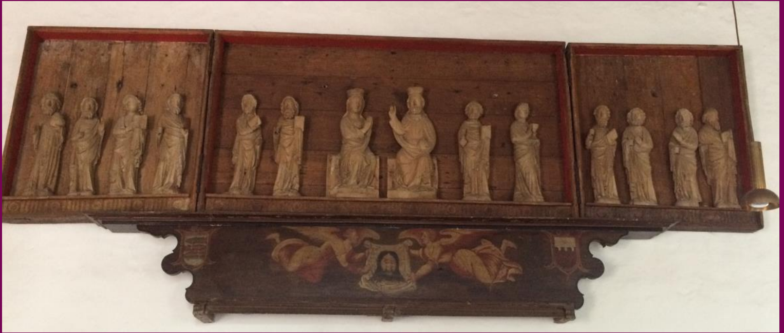
Abb. 3: Flügelretabel, St. Annen-Kirche, St. Annen, Kreis Dithmarschen

An der Fertigstellung eines Retabels waren mehrere Gewerke beteiligt. Sie trugen alle dazu bei, auf den Altären der Kirchen die Mysterien des christlichen Glaubens anschaulich zu machen. Diese Tätigkeit ist eine sehr irdische handwerkliche Aufgabe. Sie wird in Auftrag gegeben, durchgeführt und bezahlt. Sie muss organisiert und manchmal auch gerichtlich eingefordert werden.