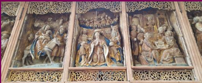
Abb. 24: Flügelretabel, Festtagsansicht, Ev. Kirche, Horst, Landkreis Vorpommern-Rügen