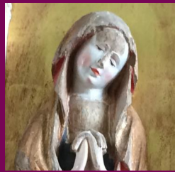
St. Georgskirche, Eixen, Landkreis Vorpommern-Rügen