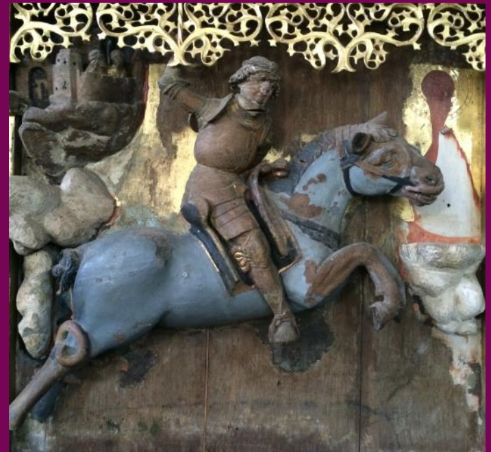
Abb. 10: St. Jürgen-Gruppe, Flügelretabel, St. Georgskirche, Eixen, Landkreis Vorpommern-Rügen

Antwerpener Retabel sind in Lübeck und Stralsund (heute in Waase auf Ummanz) zu finden. Westfälische Steinskulpturen gelangten ebenfalls über die Handelsrouten in den Nordosten. Wismarer und Lübecker Arbeiten finden sich in der Region um Stockholm, auf Gotland und in Tallin.