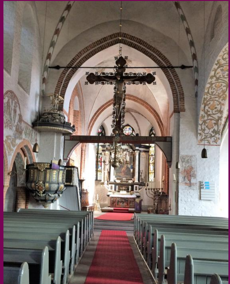
Abb. 1: Blick nach Osten in den Altarraum mit Triumphkreuz, St. Nikolaikirche, Mölln, Kreis Herzogtum Lauenburg

Die Dorf- und Stadtkirchen waren im späten Mittelalter mit einer unüberschaubaren Anzahl an Bildern unterschiedlicher Materialien und Größe ausgestattet. Es muss überwältigend gewesen sein inmitten dieser Form- und Farbenpracht, der unablässig gelesenen Messen, der Gesänge, des Weihrauchdufts, der murmelnden kommenden und gehenden Menschen zu stehen. Für die Lübecker Marienkirche sind zu Beginn des 16. Jahrhunderts 36 Nebenaltäre nachgewiesen. Jeder dieser Altäre war mit liturgischen Geräten (Kelch, Teller für die Oblaten), liturgischen Büchern, mit Altartüchern und mit Vikarien (Stelle eines Geistlichen, der die Messen liest und den Altar betreut), versehen. Unsere heutigen Kirchenräume vermitteln einen eher „aufgeräumten“ Eindruck. Die Kirche war im 15. Jahrhundert mittelbar und unmittelbar die wichtigste Auftraggeberin für Kunstwerke und ließ einen Wirtschaftszweig florieren. Heute sind es in Norddeutschland Künstler*innen, die im Rahmen von Spezialaufträgen für Kirchen, Prinzipalstücke (Altäre, Taufbecken), Glasmalereien und Paramente anfertigen.