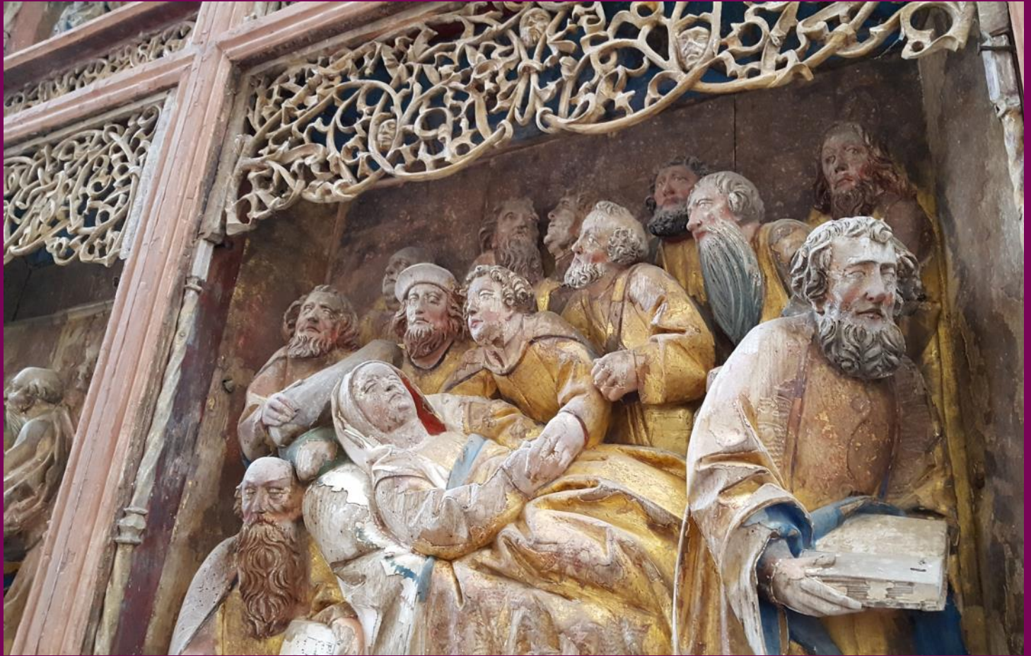
Abb. 12: Marientod, Detail, Flügelretabel, Ev. Kirche, Horst, Landkreis Vorpommern-Rügen