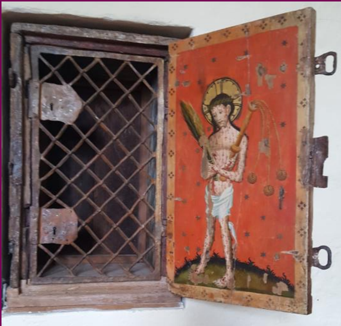
Abb. 18: Sakramentsschrank, Ev. Kirche, Laase, Landkreis Rostock

Kontormacher waren also im Möbelbau tätig. Ihre Arbeitserfahrungen, ihre handwerklichen Techniken stammen aus diesem Bereich. Heiligenschreine und Flügelretabel sind vor diesem Hintergrund als „liturgische Möbel“ zu verstehen: Sie haben eine Funktion in der kirchlichen Liturgie. Ihr Aufbau und ihre Konstruktion ist kein Selbstzweck. Stattdessen ist es ihre Funktion, Bilder in sich aufzunehmen und sie gemäß der gewünschten inhaltlichen Bedeutung sinnvoll zu gliedern. Darüber hinaus sollen die Bilder nicht immer sichtbar sein. Der Schrein hat ebenfalls die Aufgabe, die Bilder in ein hierarchisch gegliedertes System einzubinden, in dem Bilder verborgen und sichtbar gemacht werden können.