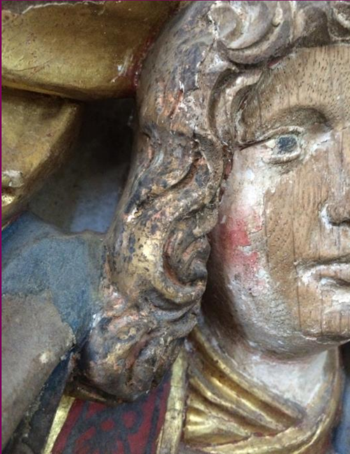
Abb. 5: Erzengel Michael, Detail, Flügelretabel, St. Georgskirche, Eixen, Landkreis Vorpommern-Rügen

Das Bildprogramm , die Form des Rahmens und die Verteilung der Figuren im Schrein konnten in einem Vertrag mit dem Auftraggeber schriftlich oder in einer Risszeichnung festgehalten werden. Leider sind heute nur noch sehr wenige solcher Verträge und Zeichnungen erhalten. Sie bilden eine wichtige Quelle unserer Kenntnisse über die Auftragsvergabe und die Arbeitsprozesse in der Retabelproduktion.