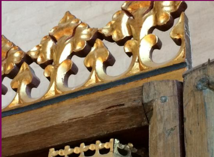
Abb. 20: Eckverbindung, Schreinkasten, Flügelretabel, St. Peter und Pauls Kirche, Teterow, Landkreis Rostock

gewährleisten eine stabile Eckverbindung der Kastenflügel. Diese Art der Eckverbindung setzte sich im ersten Drittel des 15. Jahrhunderts in der Retabelproduktion in Norddeutschland flächendeckend durch.