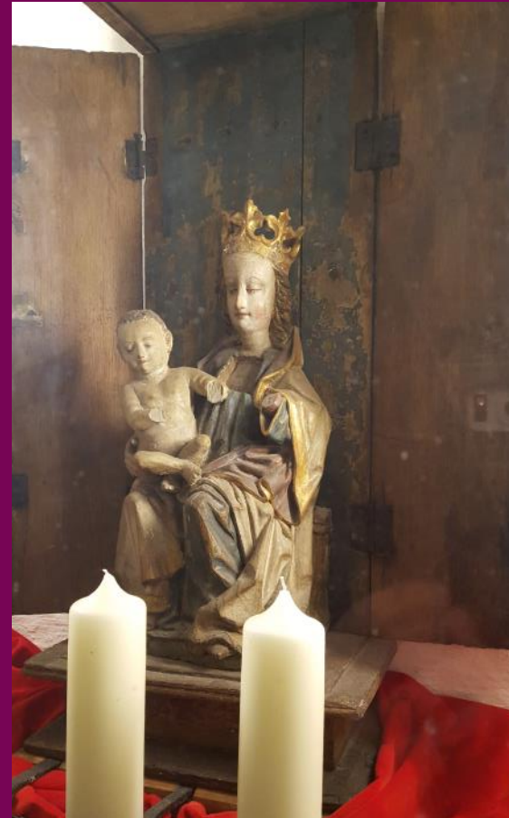
Abb. 16: Thronende Madonna, Heiligenschrein St. Nicolai-Kirche, Mölln, Kreis Herzogtum Lauenburg

Der Kontormacher bekam die Maße des Schreins von dem Auftraggeber direkt oder über den Hauptauftragnehmer für das Retabel/den Heiligenschrein übermittelt. Auch wenn wir über die Einzelheiten der Auftragsvergabe und Arbeitsschritte nicht informiert sind, wird trotzdem deutlich, dass es zwischen den einzelnen an der Herstellung des Heiligenschreins beteiligten Gewerke – dem Kontormacher, dem Bildschnitzer und dem Fass- und Tafelmaler sowie dem Kleinschmied eine enge Kommunikation über die Maße und die Binnengliederung des Schreines gegeben haben muss: Der Schrein wurde passgenau für den Aufstellungs-ort hergestellt und die Figuren mussten ebenso passgenau für den Schrein angefertigt werden. Die Scharniere mussten dem Gewicht der Flügel entsprechen.