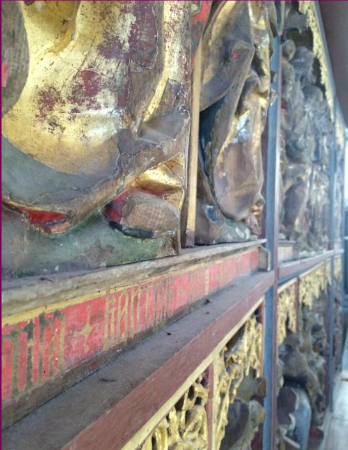
Abb. 14: Retabel, Festtagsansicht St. Georgskirche, Eixen, Landkreis Vorpommern-Rügen

Zeitraum von 300 Jahren im europäischen Raum entwickelt hat, ist groß. Zunächst sind es Altarkreuze sowie Kult- und Andachtsbilder, die dauerhaft auf den Altären der Kirchen ihren Platz hatten. Zum Beginn des 14. Jahrhunderts begegnen wir großformatigen Gehäusen auf den Altären von Klosterkirchen, die die reichen Reliquienschatze bargen (Kloster Cismar, Kreis Ostholstein, Münster Doberan, Landkreis Rostock). Sie besitzen mit Reliefs geschmückte Flügel oder auch wie im Falle des Schreins in Cismar eine mit szenischen Reliefs geschmückte Rückwand. Aber auch einfache Bildtafeln, die keine Aufbewahrung für Reliquienbehälter vorsahen, sondern lediglich ein gemaltes oder plastisches Bildprogramm zeigen, begleiteten das liturgische Geschehen am Altar als Bildzeugen. Der Begriff tafel hält sich in den Quellen als Bezeichnung für jede Form von Altaraufsatz durch das gesamte späte Mittelalter hindurch.