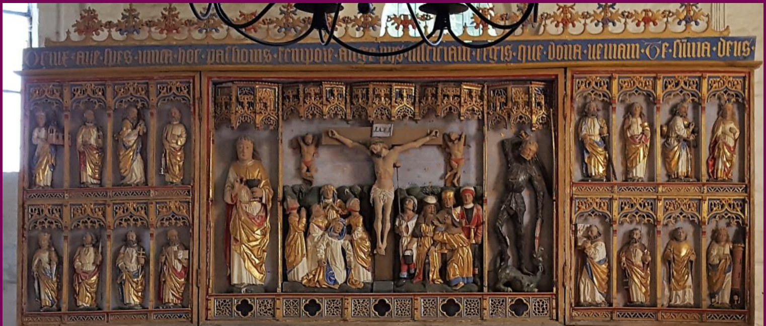
Abb. 23: Flügelretabel aus der Kirche in Crivitz, Festtagsansicht, Ev. Kirche, Garwitz, Landkreis Ludwigslust-Parchim

Zu Beginn des 16. Jahrhunderts veränderte sich die Formensprache der Innenarchitektur. Es dominieren nun aus dem Südwesten Deutschlands importierte Motive mit Ast- und Rankenwerk. Das Retabel in Horst, Landkreis Vorpommern-Rügen ist ein fantastisches Beispiel für diesen „modernen“ Typus.