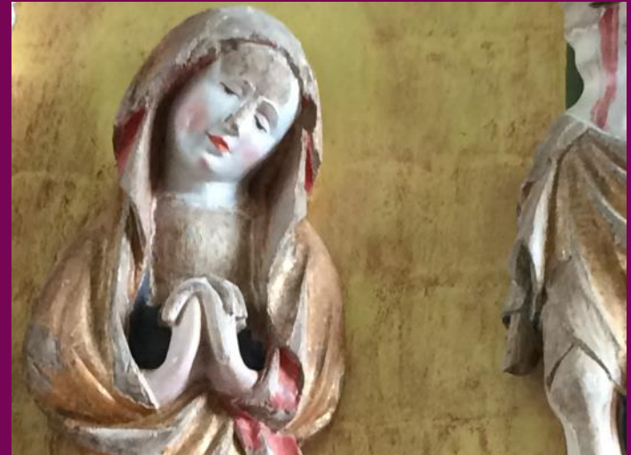
Abb. 8: Maria einer Kreuzigungsgruppe, Flügelretabel, Petrikirche, Demern, Landkreis Nordwestmecklenburg

Wie wichtig die Fassung für die Qualität des vollendeten Werkes tatsächlich war und ist, wird immer dann deutlich, wenn mittelalterliche Holzskulpturen in späteren Jahrhunderten überfasst (übermalt) worden sind. Oftmals sind Ölfarbenanstriche des 19. und 20. Jahrhunderts zu beklagen, die die Schnitzarbeiten verunklären und qualitativ herabsetzen.