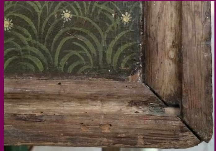
Abb. 22: Eckverbindung, Gemäldeflügel, Flügelretabel, Johanneskirche, Wusterhusen, Landkreis Vorpommern-Greifswald