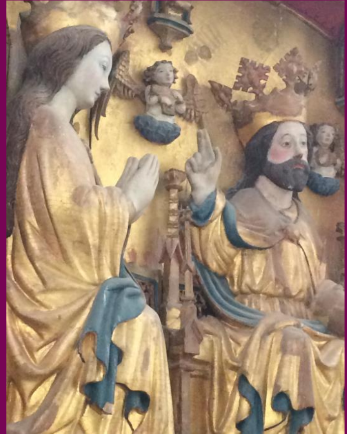
Abb. 6: Marienkrönung, Detail, Flügelretabel, St. Johanniskirche, Malchin, Landkreis Mecklenburgische Seenplatte

Bevor die Arbeit an einem solchen umfangreichen Werk aufgenommen werden konnte, musste die Finanzierung geklärt und eine Abschlagszahlung an die Malerwerkstatt geleistet worden sein. Im Auftrag musste geregelt sein wie viel Gold für Skulpturen, Hintergründe und weitere vergoldete Partien in der Tafelmalerie (Abb. 49) von der Malerwerkstatt bereitgestellt werden musste. War die Verwendung sehr kostbarer Pigmente wie etwa Lapislazuli (Ultramarin) vereinbart worden, mussten auch diese zuvor beschafft werden.