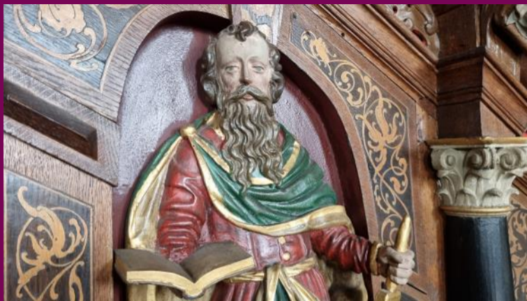
Darstellung des Apostel Paulus am Kanzelaufgang

Paulus war ein äußerst einflussreicher Vermittler des Christentums im Mittelmeerraum. Er reiste in zahlreiche Städte der antiken Welt, besuchte dort junge christliche Gemeinden und beriet sie in Fragen des Glaubens und der Glaubenspraxis. Dazu schrieb er auch Briefe wie etwa an die Gemeinde in Rom, in denen er die Bedeutung der Taufe erklärte.