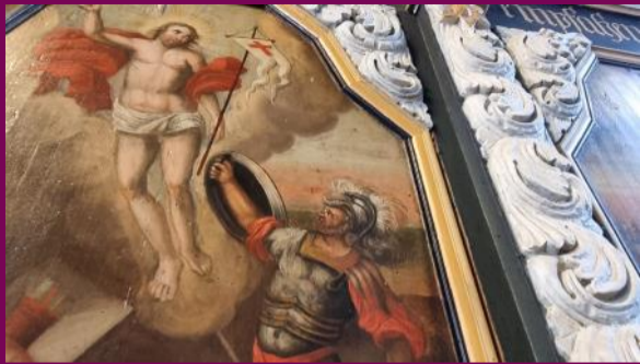
Christi Himmelfahrt, Malerei der Emporenbrüstung, Detail, um 1731

Emporen wurden im 17. und 18. Jahrhundert in zahlreiche Kirchen eingebaut. Sie erweiterten das Sitzplatzangebot für die Gottesdienstbesucher*innen.