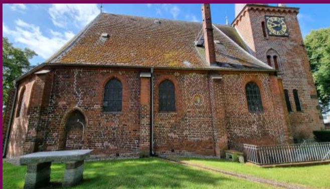
Nordseite der Kirche mit Baunaht

Bauforscher*innen können im Mauerwerk lesen wie in einem Buch. Es informiert uns über die verschiedenen Bauphasen der Kirche: In der Mitte der Nordwand ist eine von oben nach unten verlaufende Baunaht zu sehen. Rechts der Baunaht sind die Backsteine ein klein wenig flacher als die Steine links davon. Diese Abweichung führte unvermeidlich zu einer Verschiebung der Steinlagen, die durch eine Zwischenschicht ausgeglichen werden musste.