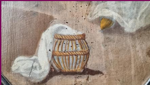
Die Verkündigung an Maria, Malerei an der Emporenbrüstung, Detail, um 1731

Diese private Szenerie, in der Maria als gebildete (lesende) und fromme (betende) Frau dargestellt wird, geht auf die spätmittelalterliche Malerei zurück.