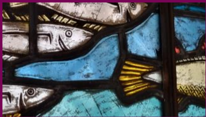
Der Fischzug des Petrus, Glasmalerei von Curt Stoermer, 1936, Detail

Das 19. Jahrhundert brachte für die Fischerei vor allem aber für die Fischverarbeitung große Umwälzungen mit sich: Die Fische wurden nicht mehr nur auf dem Lübecker Markt verkauft. Sie konnten nun in Dosen konserviert und damit über deutlich längere Zeiträume haltbar gemacht werden. Auch der Transport erleichterte sich durch die praktischen Verpackungen. Die Räuchereien belieferten nun ein größeres Umfeld, wodurch die Nachfrage nach Räucherware stieg.