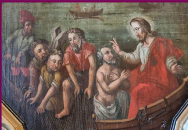
Fischzug Petri, Tafelmalerei der Emporenbrüstung, um 1731

Im Stiftungsbrief sind alle Heiligen aufgeführt, denen die neue Kirche geweiht wurde. An erster Stelle wird Maria genannt, die Mutter Jesu. Es folgt der Apostel Andreas, der Titelheilige der Schlutuper Kirche. An dritter Stelle kommt Nikolaus, der Schutzheilige der Schiffer, gefolgt von den Heiligen Barbara und Katharina.