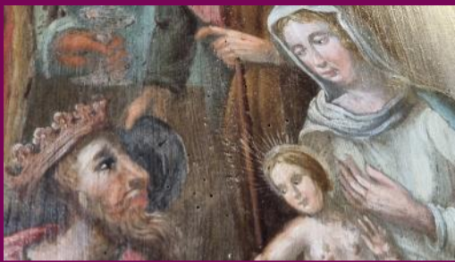
Die Anbetung der Könige, Malerei an der Emporenbrüstung, Detail, um 1731

1731 konnte durch eine großzügige Stiftung die Empore erweitert werden. Sie reichte nun über den Turmraum hinaus in das Kirchenschiff hinein und wurde von den heute noch erhaltenen Säulen gestützt.