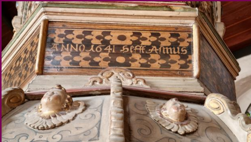
Intarsieninschrift am Taufdeckel