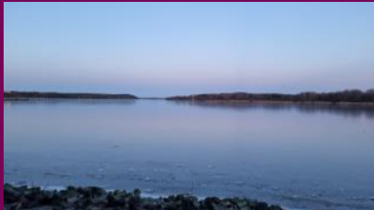
Blick auf die Trave

Schlutup ist seit jeher Grenzort zwischen der Stadt Lübeck und dem Herzogtum Mecklenburg gewesen. Der Handelsweg von Lübeck nach Schwerin, Gütertransportweg und Kommunikationsader vom Mittelalter bis in die Neuzeit, führte durch den Ort.