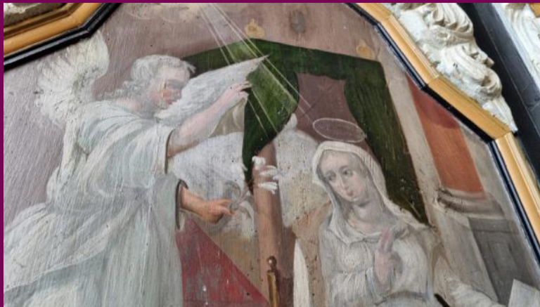
Die Verkündigung an Maria, Malerei an der Emporenbrüstung, Detail, um 1731

Bei der Darstellung der Verkündigung an Maria hält sich der Maler an traditionelle Vorlagen, die noch bis ins späte Mittelalter zurückreichen: Der Engel Gabriel tritt von links an Maria heran. Während er die göttliche Botschaft übermittle, dass Maria Gottes Sohn zur Welt bringen wird, öffnet sich der Himmel und Strahlen göttlichen Lichtes erreichen Maria. Sie kniet vor einem Lesepult. Die Szene spielt in ihrem Wohnraum.