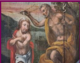
Taufe Jesu im Jordan, Tafelmalerei der Emporenbrüstung, um 1731

Für die Taufe ihrer Kinder allerdings mussten die Schlutuper auch noch nach dem Bau der steinernen Kirche den weiten Weg in die Innenstadt zurücklegen.