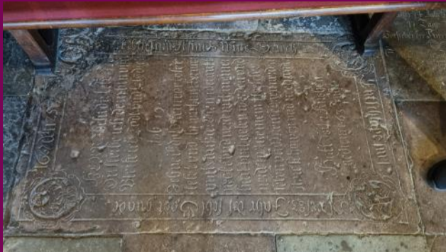
Grabplatte Asmus Witte im Chorraum, vor dem Kanzelaufgang

Ein anderes Epitaph erinnert an den 1667 verstorbenen Küster Asmus Witte. Der Rahmen zeigt üppiges Knorpelwerk - ein typisches Ornament des Barock.