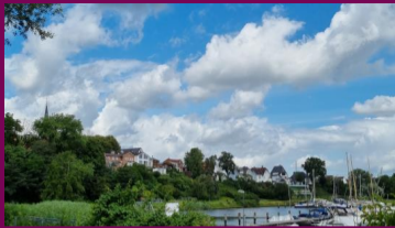
Blick vom Traveufer auf den alten Ortskern mit der St. Andreas-Kirche

Im Nordosten Lübecks am Lauf der Trave liegt das alte Fischerdorf Schlutup. Das Dorf schaut eine lange Geschichte zurück: Es war jahrhundertlang „Versorgerin“ der Lübecker Stadtbevölkerung mit lebensnotwendigem Fisch. Es war Grenzort der städtischen Landwehr zum Herzogtum Mecklenburg und schließlich zur DDR. Es war Ort einer prosperierenden Fischverarbeitungsindustrie an der Wende zum 20. Jahrhundert und einer Munitionsfabrik für die Waffenproduktion im 2. Weltkrieg, die Kriegsgefangene als Zwangsarbeiter einsetzte. Spuren dieser wechselhaften Geschichte sind im Ort noch heute zu finden.