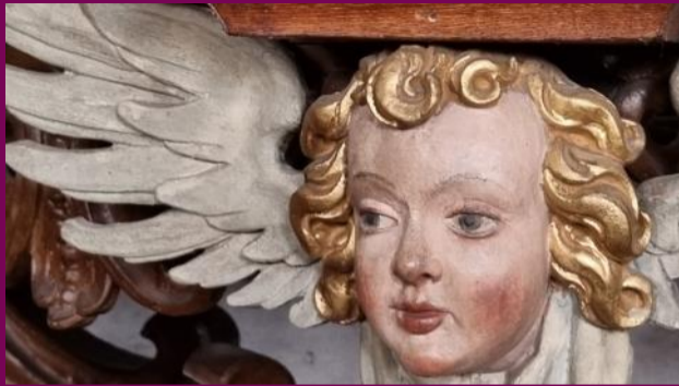
Engelskopf an der Unterseite des Kanzelkorbes

Nach der Lehre des Reformators Martin Luther ist die Verkündigung des Gotteswortes ein zentraler Bestandteil des Gottesdienstes. Dafür brauchte es ein geeignetes Möbel. - Die Kanzel war es. In ihr stand der Pastor erhaben über der Gemeinde. So war er akustisch gut zu verstehen. Der Schalldeckel verbessert die Schallübertragung in den Kirchenraum hinein .