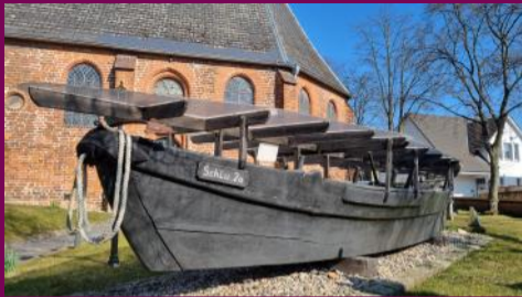
Alter Fischerkahn auf dem Kirchhof, gebaut 1965, genutzt bis 1986,

Die Bewohner Schlutups waren hauptsächlich Fischer, aber auch Bauern und Müller. Die Fischerei deckte im Mittelalter und in der frühen Neuzeit einen bedeutenden Teil der Nahrungsmittelversorgung der Stadtbevölkerung.