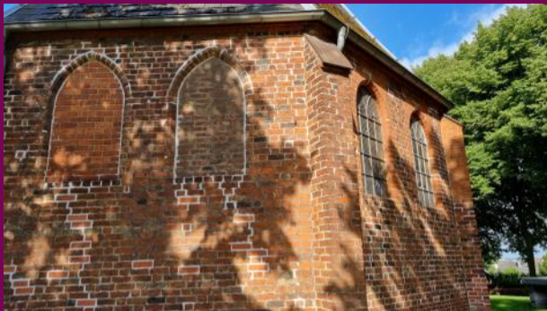
Vermauerte Fenster in der Ostwand, vermutlich um 1600

Die Kirche hat im Laufe der Jahrhunderte zahlreiche Reparaturen und Umbaumaßnahmen erlebt. Einige sind deutlich sichtbar, wie etwa die Vermauerung der beiden Ostfenster und der kleinen Pforte auf der Nordseite.