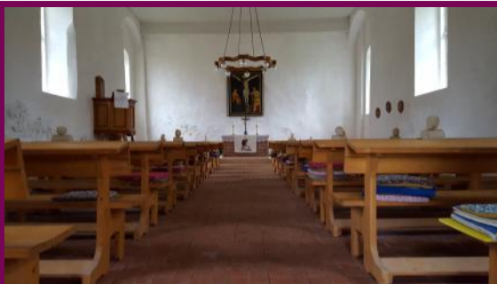
St. Katharinenkirche, Leplow, Blick nach Westen

Der Innenraum der Kirche ist recht karg ausgestattet. Aber es ist alles da, was eine Predigtstätte braucht: ein Altar, eine Kanzel und das Gestühl für die Kirchenbesucher*innen.