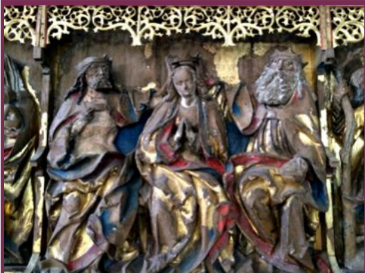
Marienkrönung, Altaraufsatz (Retabel), um 1530, St. Georgskirche, Eixen

Dieses Bild Mariens in Eixen ist anders, ganz anders. Zwischen den beiden Marienbildern liegen 500 Jahre und eine grundlegende Veränderung der Vorstellung von Maria. An dieser Veränderung hatte Luther einen maßgeblichen Anteil.