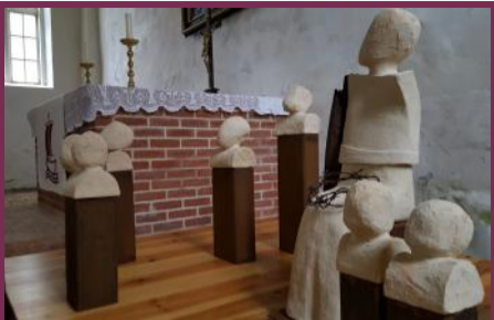
Ursula Dietze: Mit Maria, 2017, St. Katharinenkirche, Leplow

Der Text ist aber vor allem auch eine vollständige Umwertung der spätmittelalterlichen Marienverehrung. Man sah in der Mutter Gottes eine Miterlöserin und Himmelskönigin, die neben Christus im Himmel regiert. Sie wurde als die sanfte Fürsprecherin der Menschen vor dem strengen Richter Christus angesehen. Von solcher Verehrung ist in der Leplower Kirche nichts mehr zu spüren. In vielen der mittelalterlichen Kirchen in Norddeutschland sind noch zahlreiche Skulpturen, Wandmalereien und Altaraufsätze zu finden, die Maria mit Krone auf dem Kopf thronend oder von Engeln umgeben, in einen Lichtkranz darstellen. Ein Beispiel der Verherrlichung Mariens ist im nahe gelegenen Eixen anzutreffen.