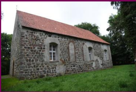
St. Katharinenkirche, Südseite

Eine der Kirchengemeinden, die sich für die Teilnahme an dem Projekt beworben hatten, ist die Evangelisch-Lutherische Kirchengemeinde Semlow-Eixen.