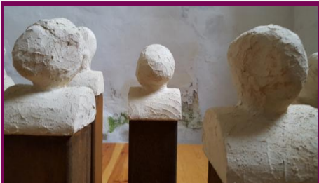
Ursula Dietze: Mit Maria, 2017, St. Katharinenkirche, Leplow

Die Köpfe haben keine ausgearbeiteten Gesichter. Und doch sind sie uns zugewandt. Sie nehmen Kontakt mit uns auf.