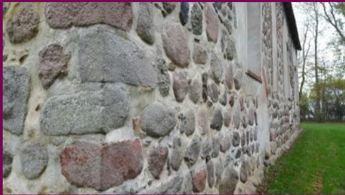
St. Katharinenkirche, Süd/Westecke

Der kleine Ort Leplow hat eine lange Geschichte: Ursprünglich war es eine wendische Siedlung, später dann Guts- und Bauerndorf.