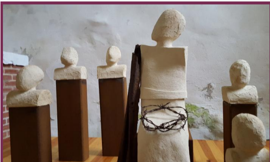
Ursula Dietze: Mit Maria, 2017, St. Katharinenkirche, Leplow

Einzigartig in ihrer Form ihrer Oberflächenstruktur, ihrer Haut, umringen die Menschen eine sitzende Figur. Sie ist größer. Sie ist anders.